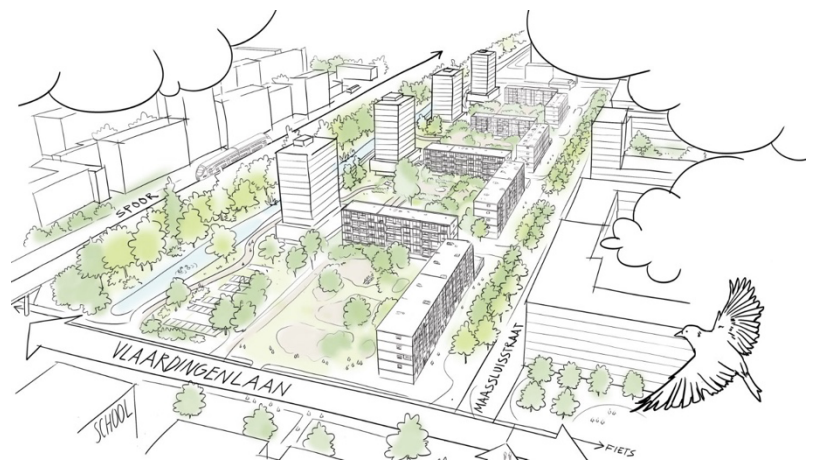
Schets bestaande situatie 1

De gemeente maakt ook een ontwerp voor de openbare ruimte tussen de Maassluisstraat en het spoor. Hier komen straks nieuwe straten, paden, groen en plekken om te spelen en elkaar te ontmoeten. Het is belangrijk dat dit een plek wordt waar mensen zich prettig voelen en graag willen zijn. Daarom kunnen bewoners ook meedenken over hoe de buitenruimte er straks uit moet zien. Welke activiteiten zij graag buiten doen, zoals wandelen, picknicken, sporten en spelen. De gemeente gebruikt deze ideeën van bewoners waar mogelijk in het ontwerp.